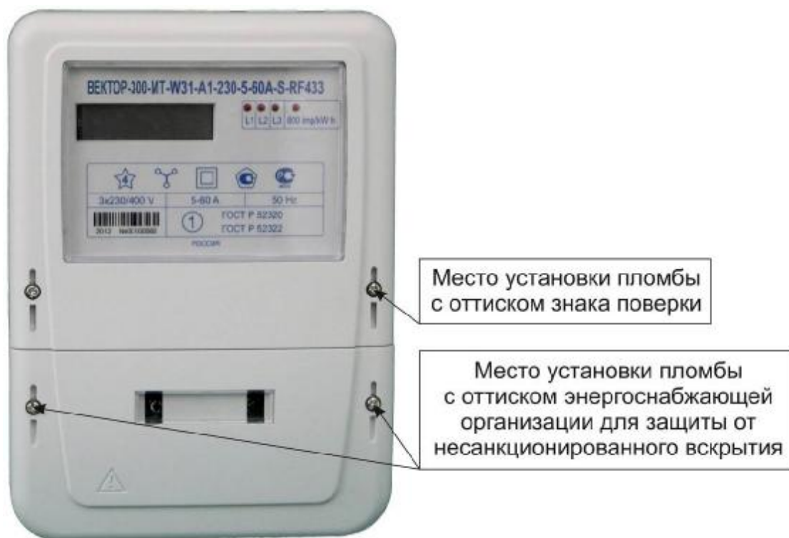
Рисунок 2 – Общий вид счетчика в корпусе модификации W31

Фотографии общего вида счетчиков, с указанием схем пломбировки от несанкционированного доступа, приведены на рисунках 2 – 7.