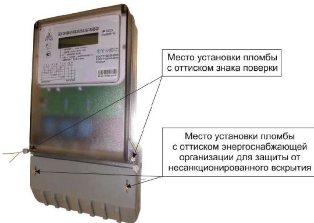
Рисунок 5 – Общий вид счетчика в корпусе модификации W36