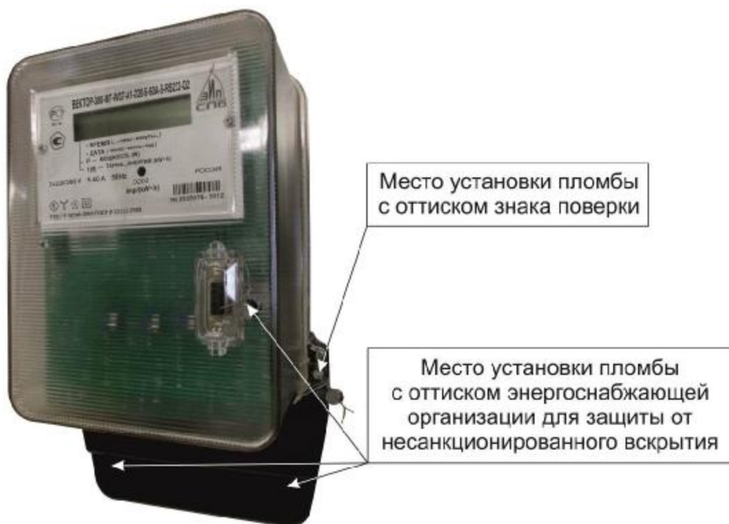
Рисунок 6 – Общий вид счетчика в корпусе модификации W37