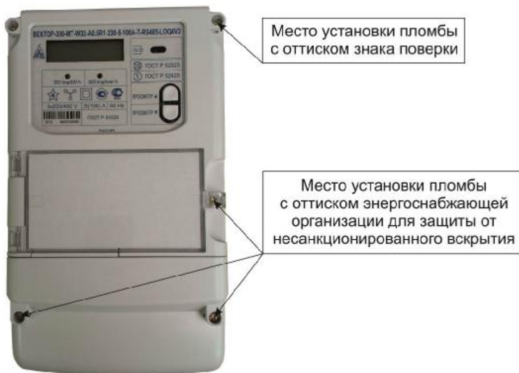
Рисунок 3 – Общий вид счетчика в корпусе модификации W32