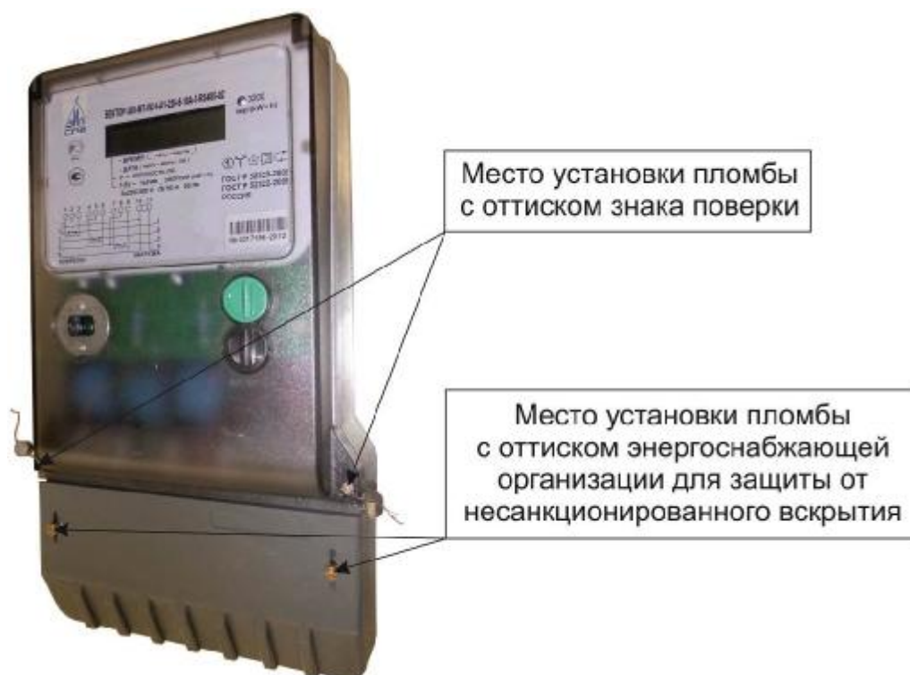
Рисунок 4 – Общий вид счетчика в корпусе модификации W34