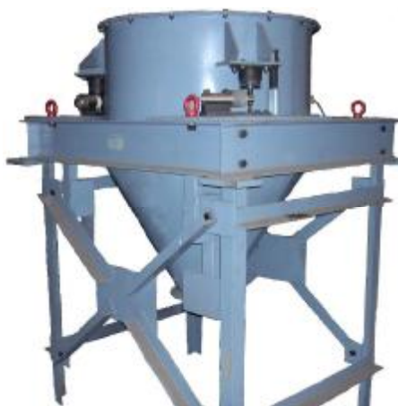
Рис. 1 Общий вид дозатора ДМ

В состав ГПУ входит бункер, установленный на три узла встройки датчиков, находящихся на опорной раме. Общий вид дозатора представлен на рисунке 1.