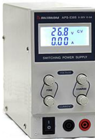
Рисунок 1. Фотография общего вида источников питания.

Фотография общего вида источников питания представлена на рис. 1. Схема пломбировки от несанкционированного доступа изображена на рис. 2.