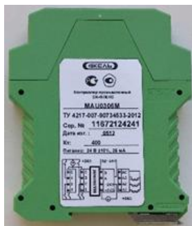
Рисунок 1 – Контроллер модификации MAU0306M

Общий вид контроллеров показан на рисунках 1-5. Пломбирование контроллеров производится в соответствии со схемами пломбирования, представленными на рисунках 6-8.