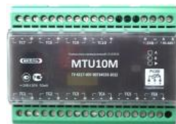
Рисунок 5 – Контроллер модификации MTU10M