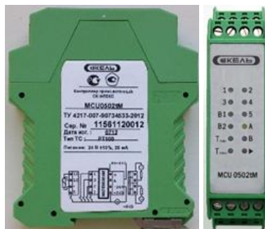
Рисунок 2 – Контроллер модификации MCU0502tM