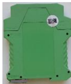
Рисунок 7 – Схема пломбирования контроллеров модификаций MTU04M, MCU0502tM, MAU0306M,