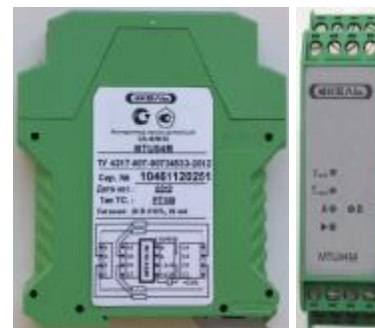
Рисунок 3 – Контроллер модификации MTU04M