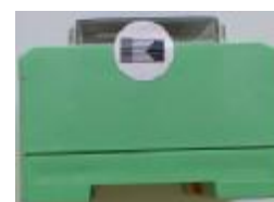
Рисунок 8 – Схема пломбирования контроллеров модификации MTU10M