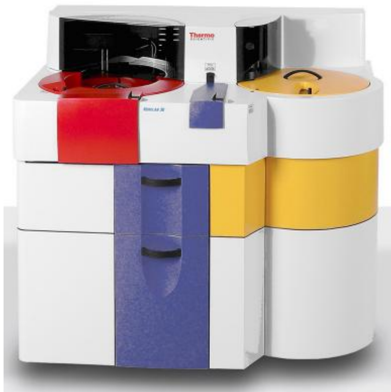
Рисунок 3 – Общий вид анализаторов моделей Konelab 30, Konelab 30i