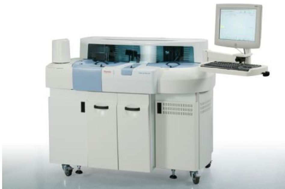
Рисунок 4 – Общий вид анализаторов моделей Konelab PRIME 30, Konelab PRIME 30i, Konelab PRIME 30 KUSTI, Konelab PRIME 30i KUSTI.