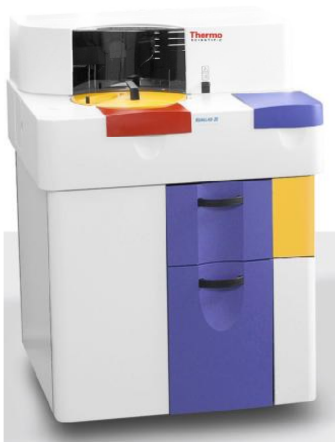
Рисунок 1 – Общий вид анализаторов моделей Konelab 20, Konelab 20i.