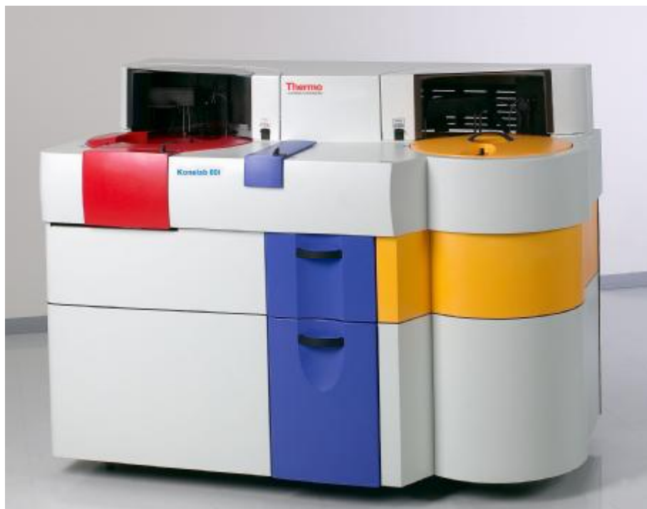
Рисунок 5 – Общий вид анализаторов моделей Konelab 60, Konelab 60i, Konelab 60 KUSTI, Konelab 60i KUSTI