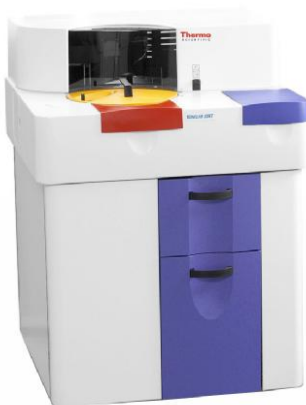
Рисунок 2 – Общий вид анализаторов моделей Konelab 20 XT, Konelab 20 XTi