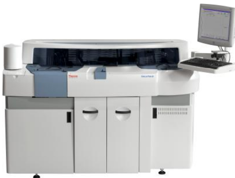
Рисунок 6 – Общий вид анализаторов моделей Konelab PRIME 60, Konelab PRIME 60 ISE, Konelab PRIME 60 ISE KUSTI.