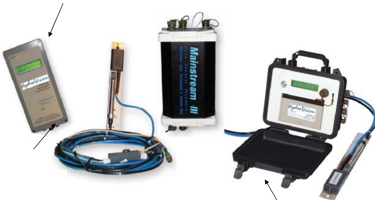
Датчики скорости и уровня