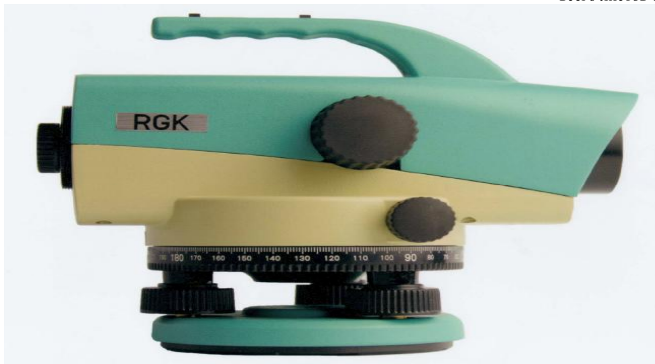
Рисунок 2 - Внешний вид нивелира