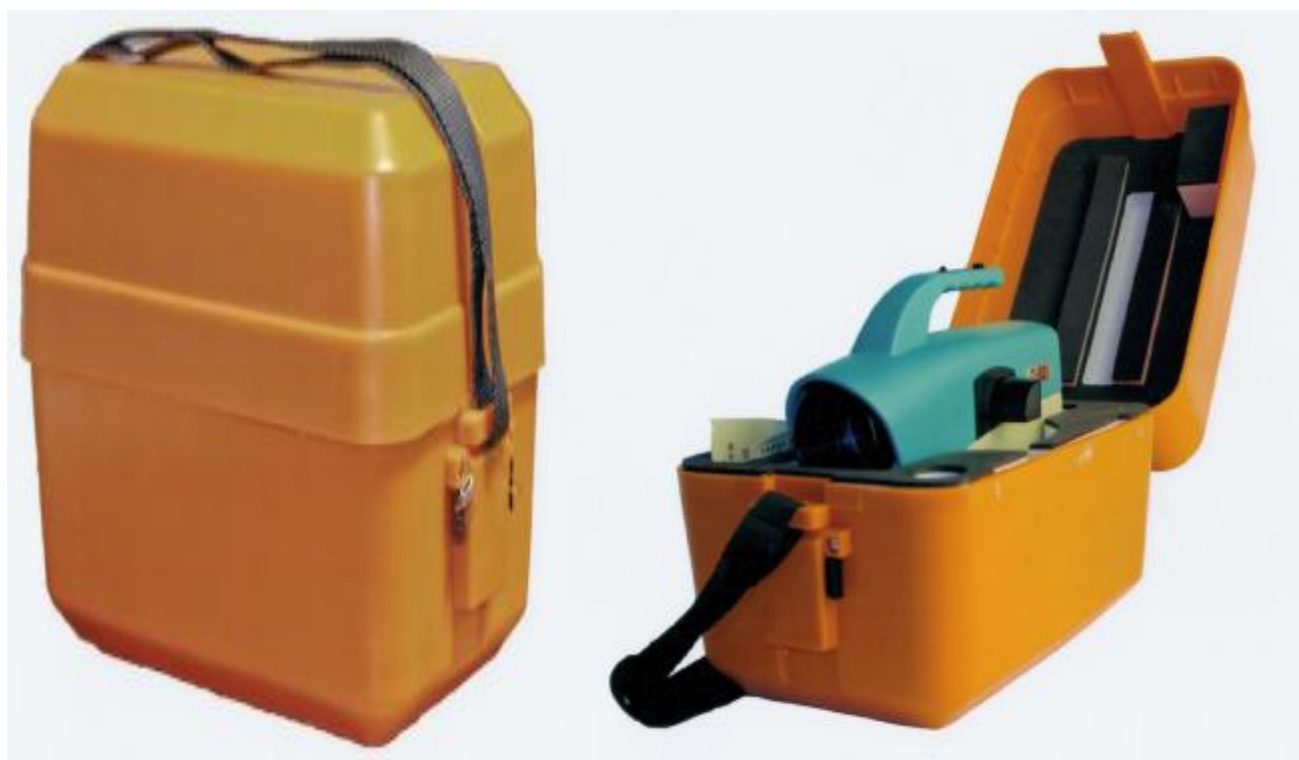
Рисунок 5 - Внешний вид транспортировочного кейса и схема размещения нивелира в транспортировочном кейсе