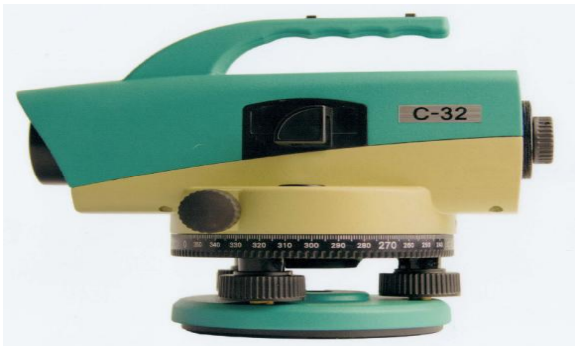
Рисунок 1 - Внешний вид нивелира

Схема пломбировки от несанкционированного доступа приведена на рисунке 6.