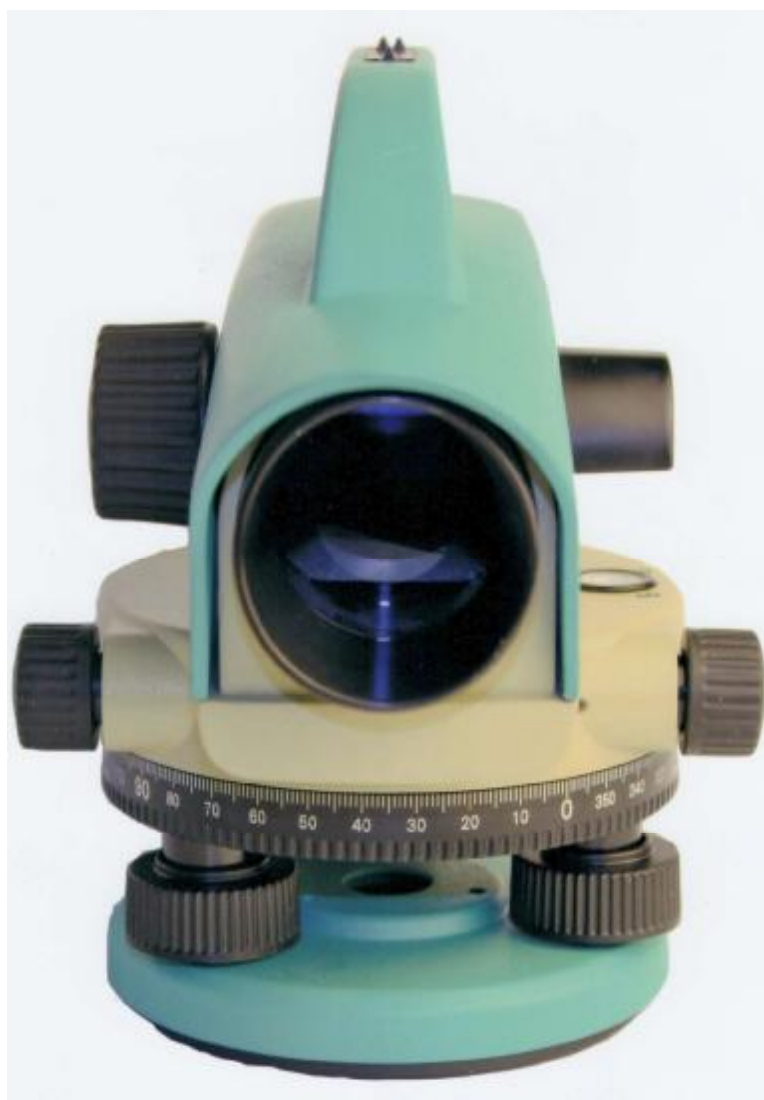
Рисунок 3 - Внешний вид нивелира