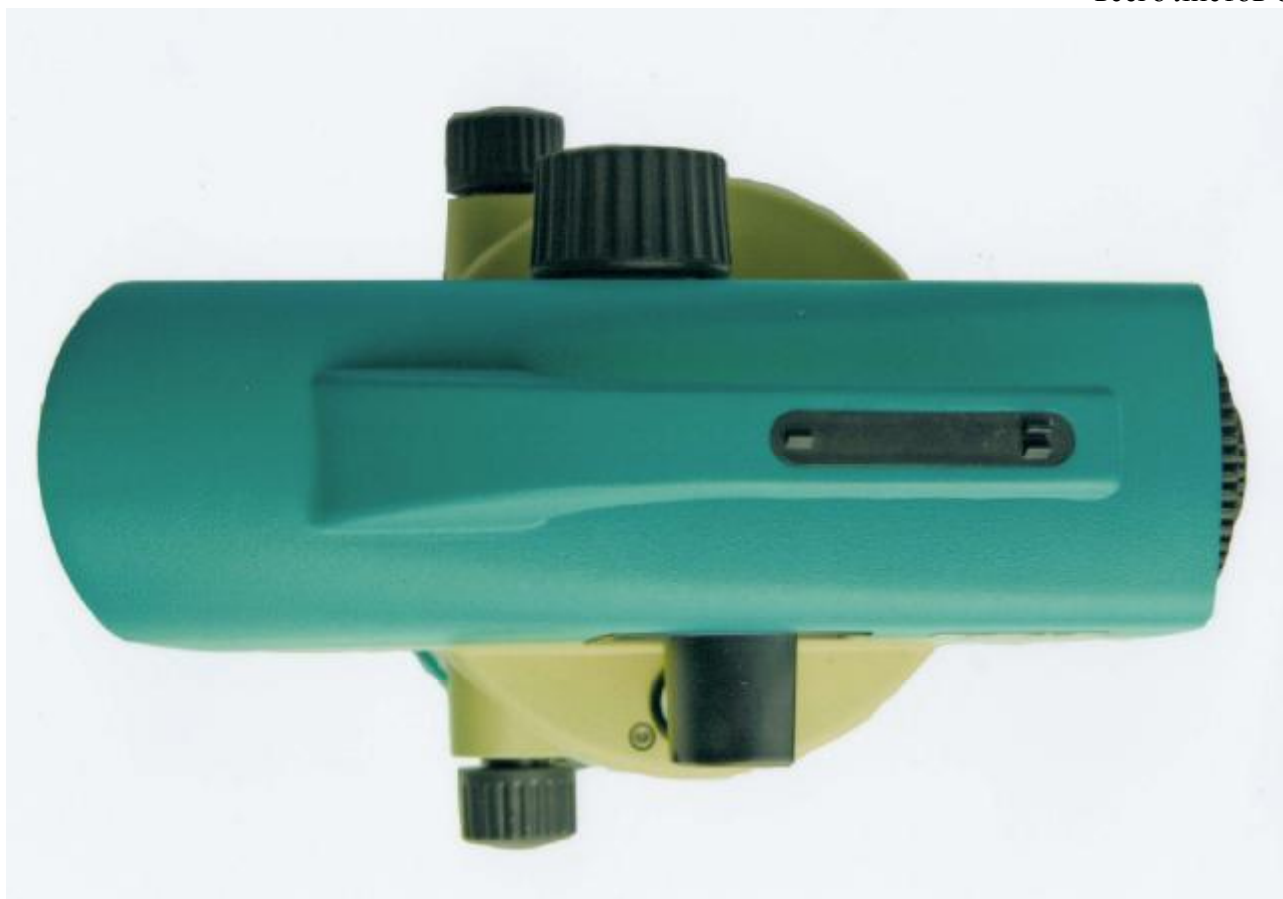
Рисунок 4 - Внешний вид нивелира