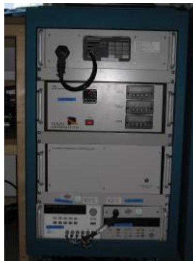
Рисунок 2 - Столик 3-х осевой позиционирующий DITS-CA со шкафом электроники