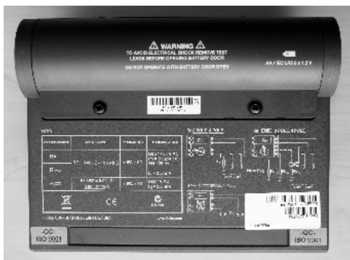
Рисунок 2 - Внешний вид тестера заземления Fluke 1625, вид снизу.