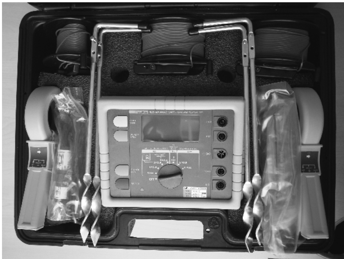
Рисунок 3 - Тестер Fluke 1625 с полным комплектом принадлежностей.

На передней панели тестеров расположены: жидкокристаллический дисплей, переключатель режимов измерений, клавиши управления, а также разъёмы для подключения измерительных проводов и измерительных клещей. Пломбирование корпуса тестеров от несанкционированного доступа не предусмотрено.