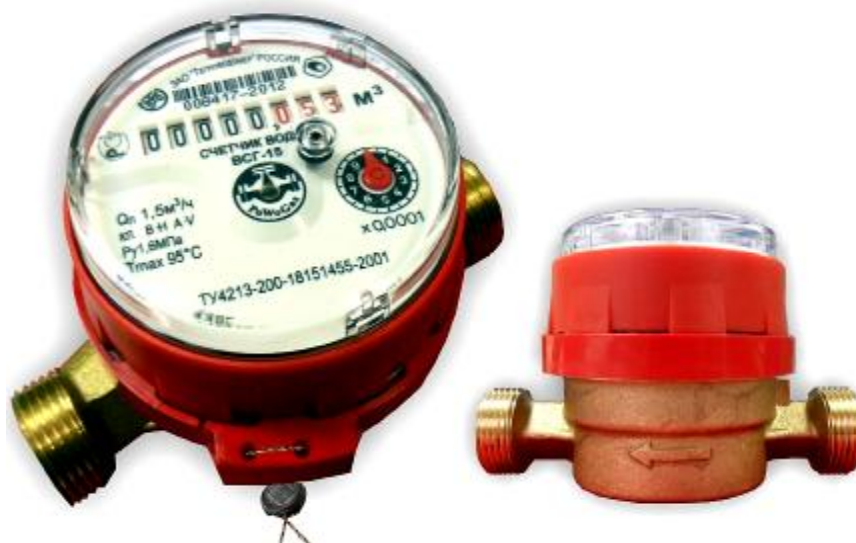
Рис.6 Счетчик горячей воды ВСГ-15-02