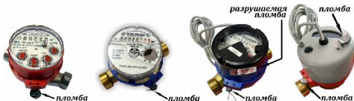
Рис.1 Схема пломбировки приборов от несанкционированного доступа

Счетный механизм крепится к корпусу при помощи пластикового прижимного кольца с ушком для опломбирования от несанкционированного вмешательства.