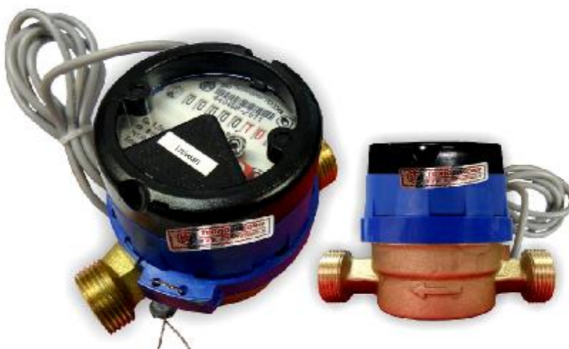
Рис.8 Счетчик холодной воды с магнитоуправляемым контактом ВСХд-15-02