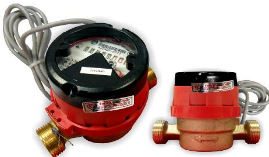
Рис.7 Счетчик горячей воды с магнитоуправляемым контактом ВСГд-15-02