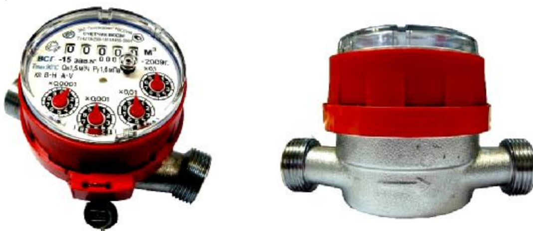
Рис 2. Счетчик горячей воды ВСГ-15

Счетчики типа ВСХ, ВСХд, ВСГ, ВСГд, ВСТ DN 15; 20 – корпус изготовлен из латуни, имеют пяти - разрядный барабанный счетный механизм и четыре стрелочных индикатора (рис.2÷4)