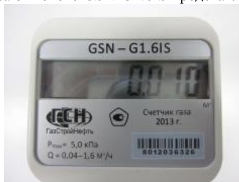
Рисунок 1. Внешний вид счетчика газа бытового GSN-G1.6IS

Внешний вид счетчика газа бытового GSN-G1.6IS представлен на рисунке 1