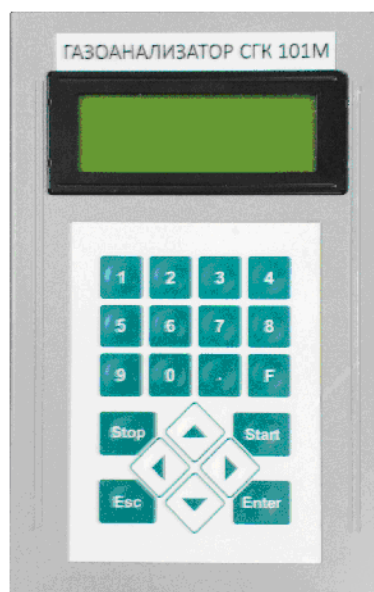
Рисунок 2 – Фотография внешнего вида измерительного модуля