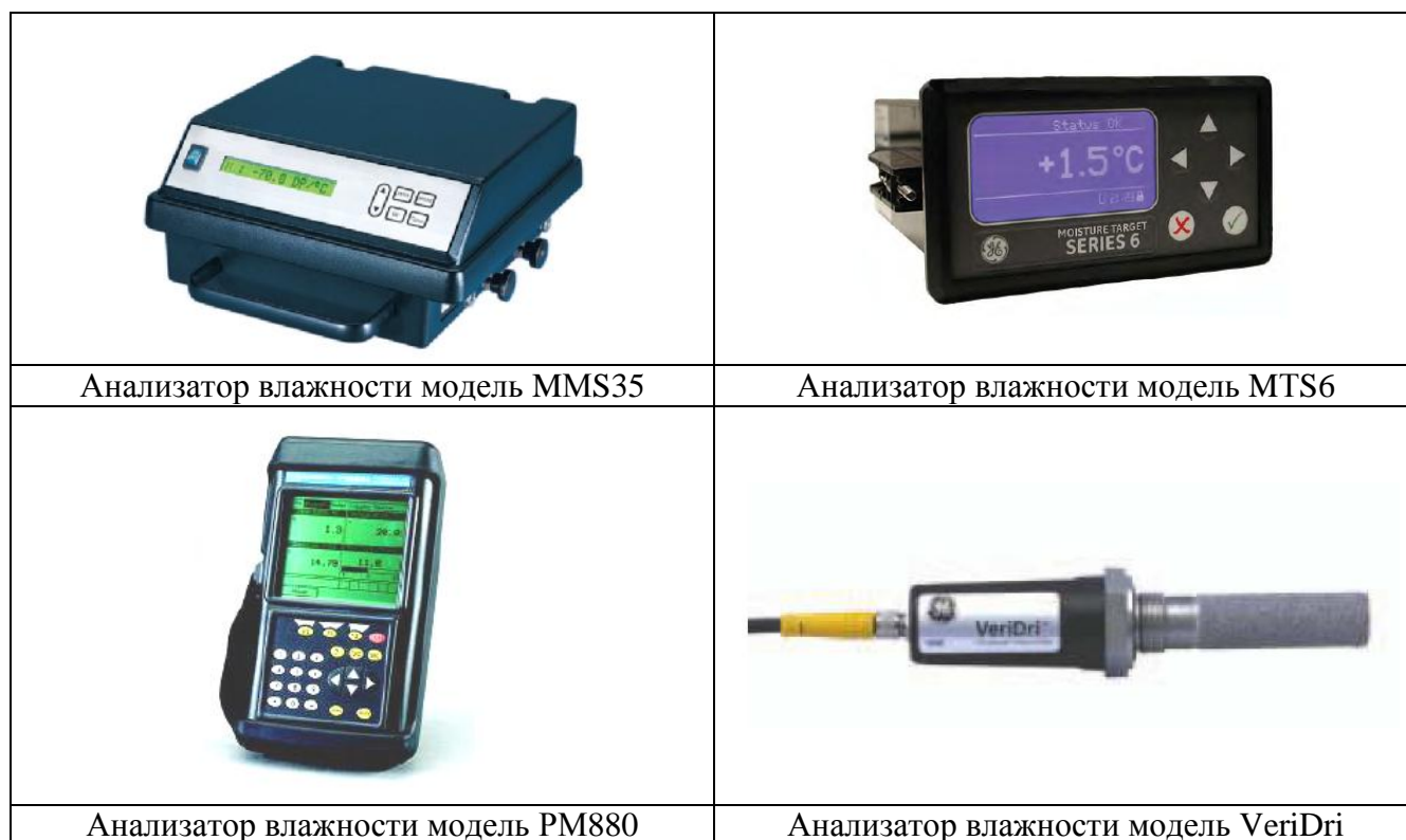
Рис. 1 Внешний вид анализаторов влажности.