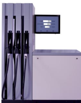
Рисунок 2 – SK65