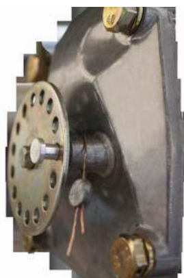
Рисунок 6 - Пломбировка регулировочного винта измерителя объёма