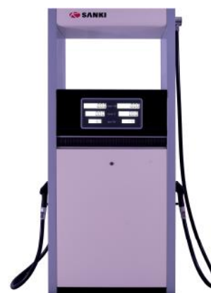
Рисунок 3 - SK52