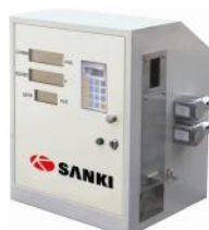
Рисунок 4 – SK22