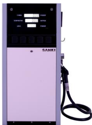
Рисунок 1 - SK10

Внешний вид колонок показан на рисунках 1 – 5.