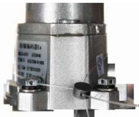
Рисунок 7 - Пломбировка датчика импульсов