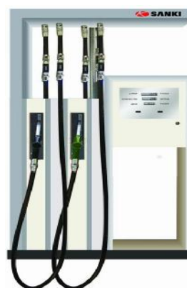
Рисунок 5 – SK66

Схема пломбировки показана рисунках 6-8. Пломба с оттиском клейма поверителя устанавливается на измерителе объема поршневого типа и на крышке электронно-вычислительного устройства.