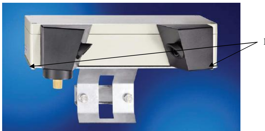
Рисунок 2. Схема пломбирования нефелометров VS20-UMB Пломбы – 1.