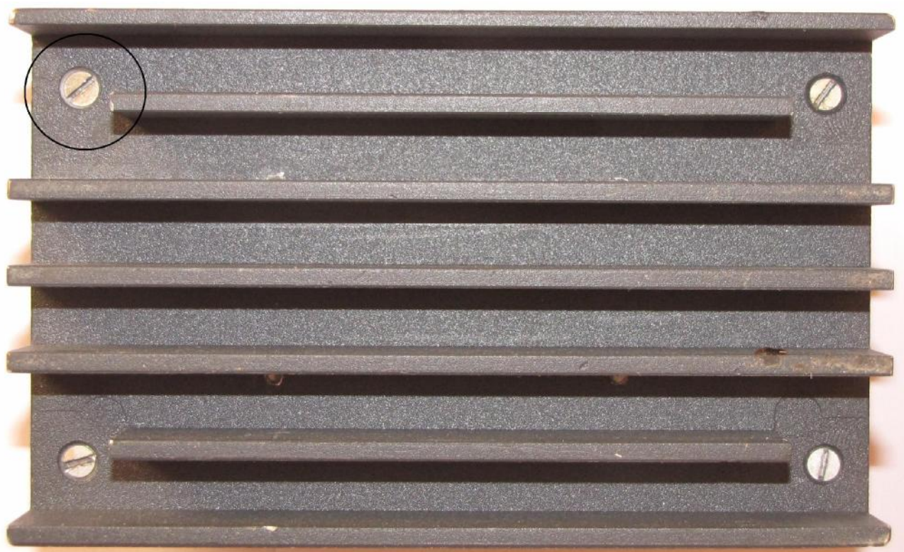
Рисунок 2. Мера сопротивления МС-10. Вид снизу. Кругом обозначено место клеймения.