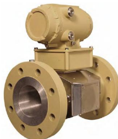
УПР модели 3812