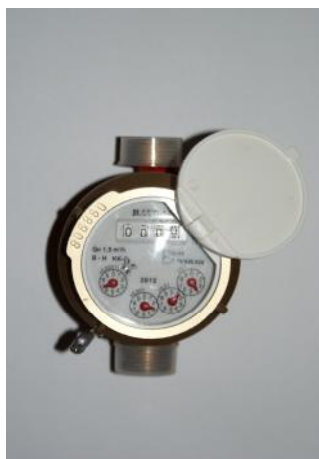
КК - 12