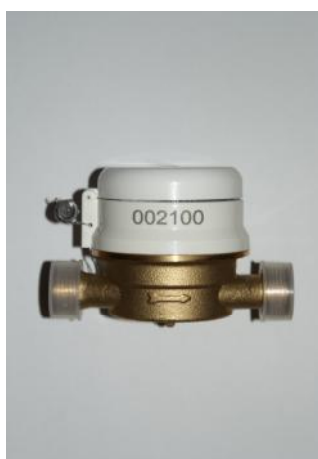
КК - 12

Для предотвращения несанкционированного доступа к индикаторному и регулирующему устройствам, пломба с клеймом поверки навешивается на проволоке соединяющей защитное кольцо крышки счетчика и регулирующее устройство.