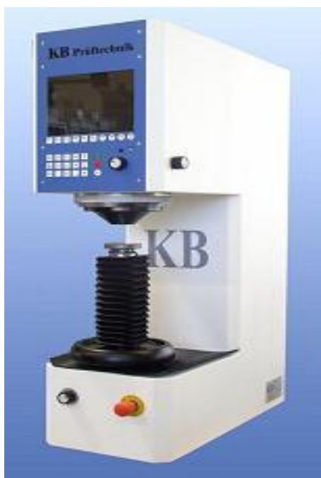
Рисунок 1 - Внешний вид твердомеров.

Для ввода параметров измерений и отображения результатов приборы имеют два исполнения: в одном для вывода результатов используется встроенный сенсорный монитор, в другом вынесенный персональный компьютер. Внешний вид твердомеров приведён на рисунке 1.