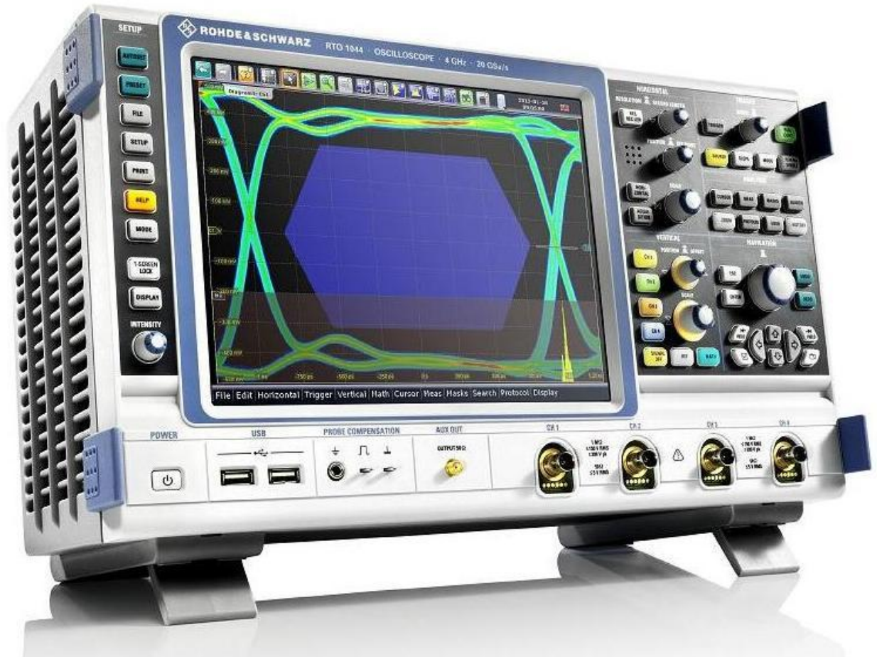
Рисунок 1. Фотография общего вида осциллографов цифровых запоминающих RTO1002, RTO1004, RTO1044