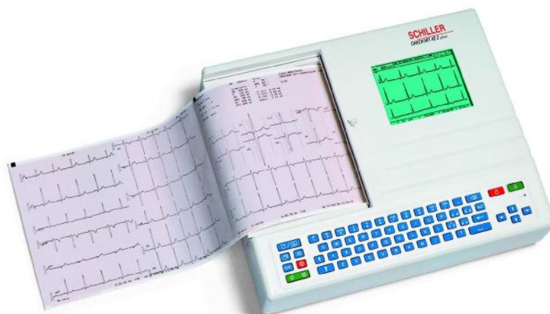
Рис.1.Общий вид электрокардиографа АТ-2 plus

В конструкции электрокардиографа предусмотрено нанесение защитного лака на фиксирующие винты электрокардиографа, ограничивающие несанкционированный доступ к внутренним частям в период эксплуатации (см.рис.2).