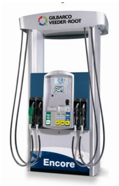
Рисунок 1. Колонка топливораздаточная Encore 500S