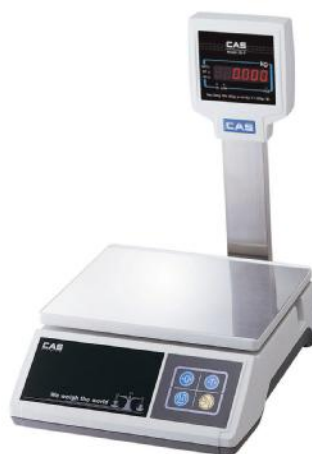
SW (модификация со стойкой)