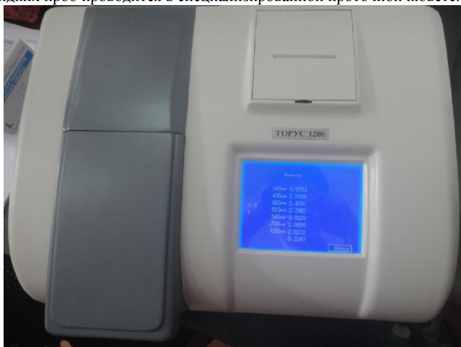
Рисунок 1 – Общий вид анализатора

Анализаторы выпускаются в настольном стационарном исполнении со встроенными интерференционными светофильтрами с длинами волн максимумов пропускания 340, 405, 492, 510, 546, 578 и 630 нм и встроенным программным обеспечением. Измерения оптических плотностей жидких проб проводится в специализированной проточной кювете.