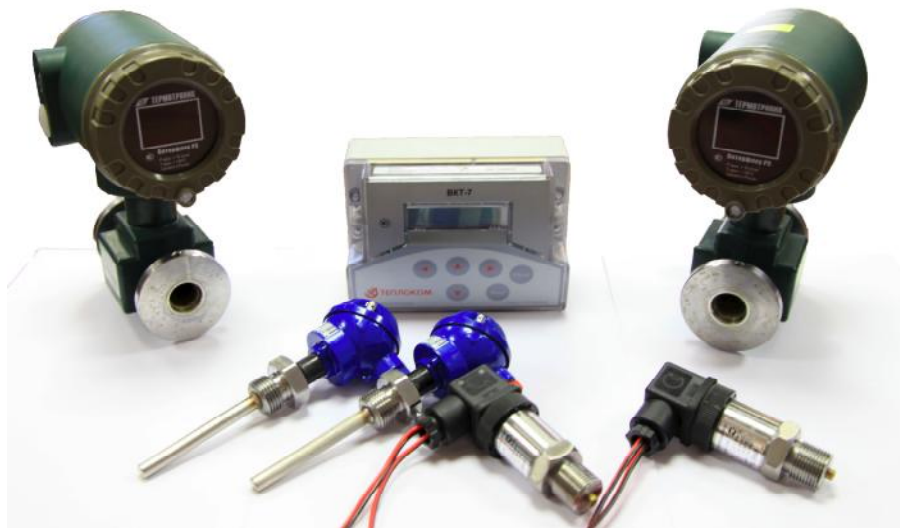
Рисунок 1 – Внешний вид теплосчетчика

Внешний вид теплосчетчика приведен на рисунке 1.