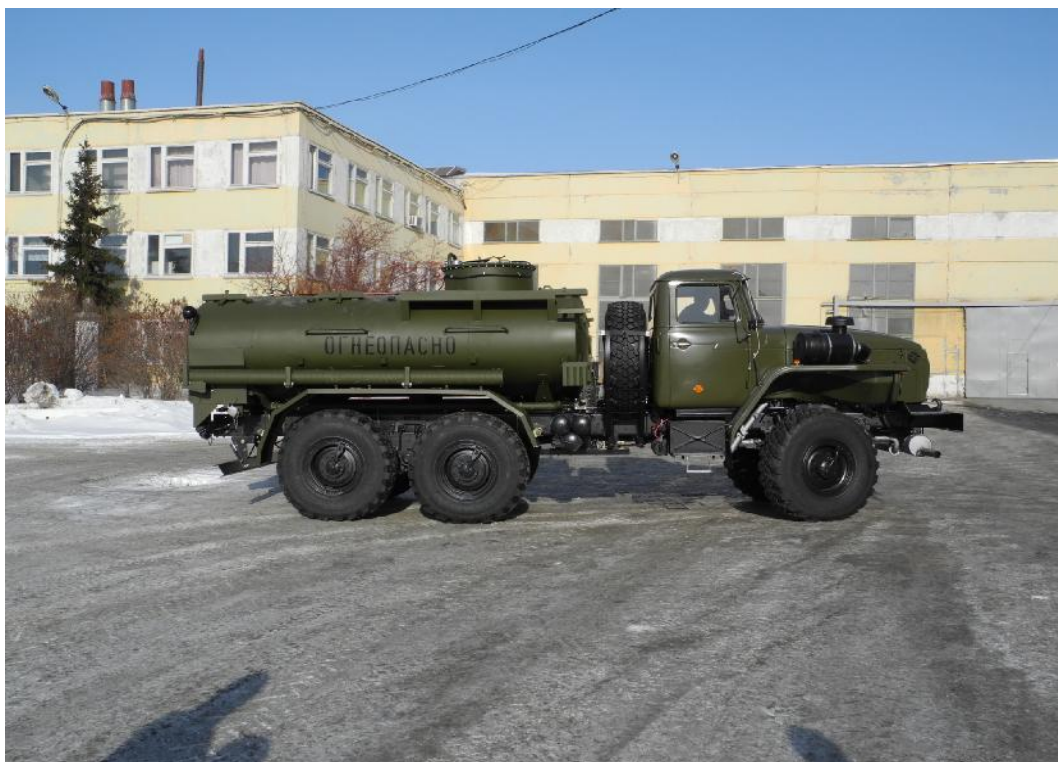
Рисунок 1 - Общий вид автотопливозаправщиков 66131-0000010-21

В состав измерительного устройства топливораздачи входит счетчик жидкости (СЖ-ППО-40/0,6, регистрационный номер 44417-10), катушка раздаточного рукава с краном РКТ-32, фильтр тонкой очистки, мановакуумметр (МВПЗ-УУ2, регистрационный номер 10135-10), кран шаровый, предохранительный клапан.