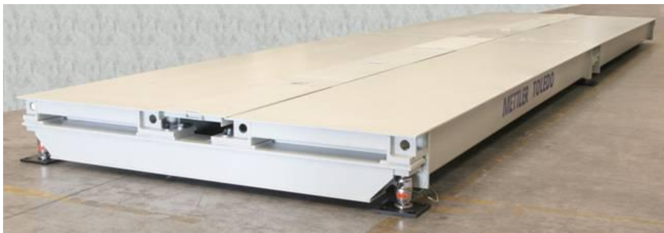
Рисунок 1 – Пример общего вида весов

На рисунках 2 и 3 показаны схемы пломбировки терминалов. Процедура пломбировки описана в Руководстве по эксплуатации на весы.