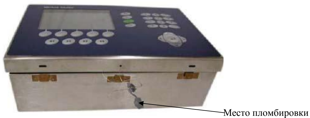
Рисунок 3 - Схема пломбировки для настольного исполнения терминалов