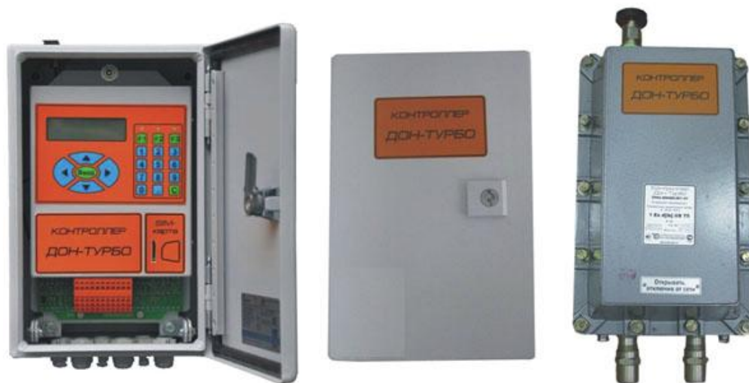
Рисунок 1 - Общий вид контроллера «Дон-Турбо»

На рисунке 1 приведен общий вид контроллера «Дон-Турбо».