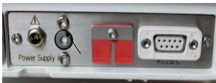
Рисунок 2 – Места пломбирования в зависимости от модификации весов