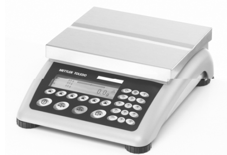
Рисунок 1 - Внешний вид весов электронных ВВх

Питание весов осуществляется от сети переменного тока или встраиваемой перезаряжаемой аккумуляторной батареи.