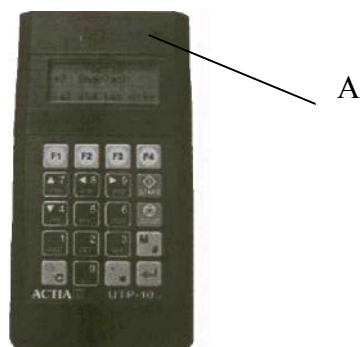
Схема пломбирования стендов измерительных параметров тахографов и спидометров 45300-1MUX, 45320, 45330-RU, 45330-BOX-RU, 45330-BOX-RU1, 45330-BOX-RU2, 46300-1MUX, 51200 с прибором измерительным УТП-10 и контрольным устройством №103581-1 от несанкционированного доступа:

Для предотвращения несанкционированного доступа к внутренним частям стендов измерительных параметров тахографов и спидометров 45300-1MUX, 45320, 45330-RU, 45330-BOX-RU, 45330-BOX-RU1, 45330-BOX-RU2, 46300-1MUX, 51200 с прибором измерительным УТП-10 и контрольным устройством №103581-1 производится пломбирование задней крышки стойки управления с помощью навесной пломбы с оттиском поверительного клейма, а также лицевой панели прибора измерительного УТП-10 с помощью клейма-наклейки в месте, обозначенном «А».