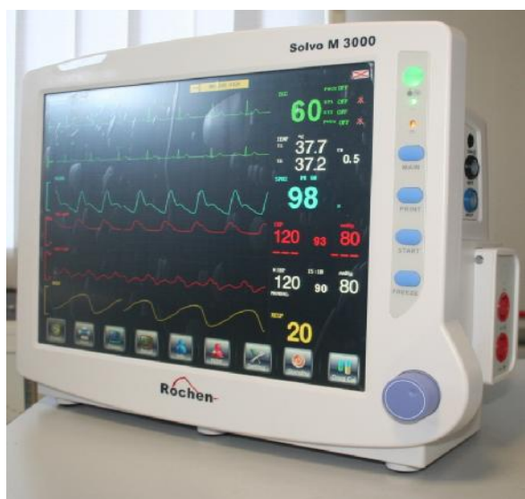
Рисунок 5. Внешний вид монитора пациента Rochen Solvo M 3000