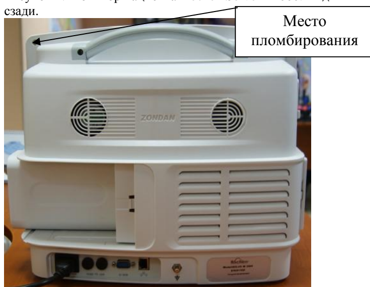
Рисунок 6. Монитор пациента Rochen Solvo M 3000. Вид сзади.