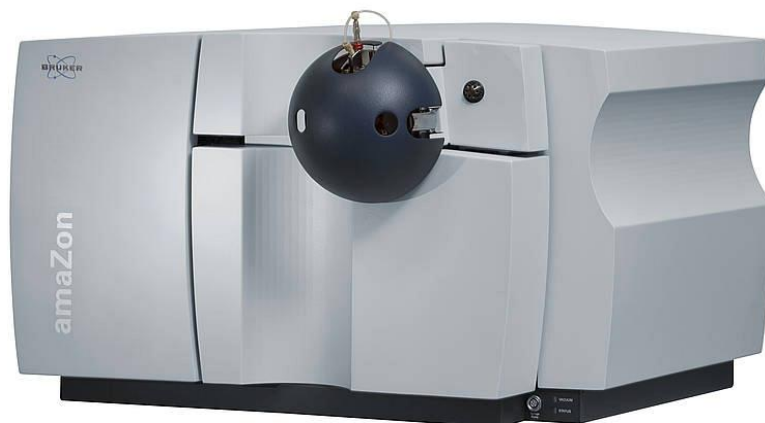
Рисунок 1 - Общий вид масс-спектрометра amaZon

Конструктивно масс-спектрометры amaZon выполнены в виде отдельных модулей, функционально связанных между собой и управляемых по заданной программе от компьютера.