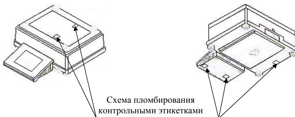
Рисунок 2 - Схема пломбирования от несанкционированного доступа весов APPxxx/Y