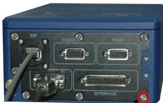
Место пломбировки от несанкционированного доступа