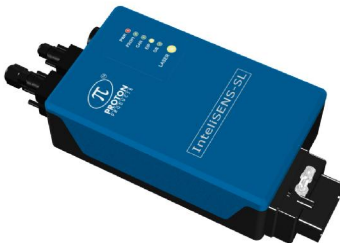
Рисунок 1 – Внешний вид измерителя

Схема для размещения наклеек приведена на рисунке 3.