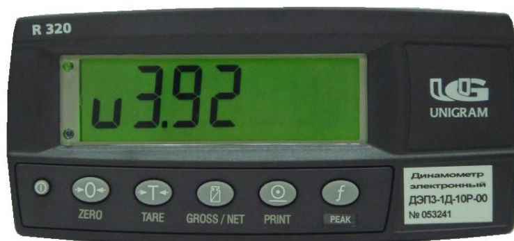
Рисунок 1. Внешний вид электронного блока с изображением версии программного обеспечения.