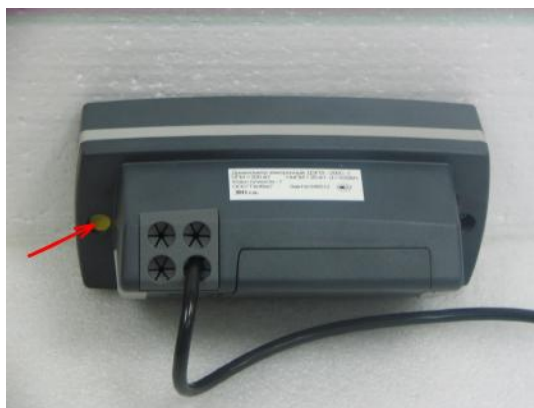
Рисунок 3. Схема пломбировки от несанкционированного доступа и обозначение места для нанесения оттиска клейма.

Динамометр электронный переносной ДЭПЗ-1Д-10Р-00 НПИ=10 кН; НмПИ=1 кН; d=0,0002 кН Класс точности: 00 Зав. №039825 ООО «ПетВес» 2011 г.в.