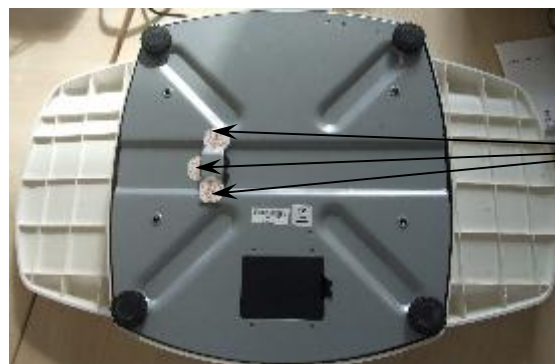
Места нанесения пломб изготовителя

Для защиты весов от несанкционированного изменения установленных регулировок (регулировки чувствительности (юстировки)), весы пломбируются пломбой изготовителя, разрушаемой при снятии. Пломба устанавливается поверх винтов стяжки корпуса и винта пластины, закрывающую переключатель для входа в режим юстировки (рис.1).