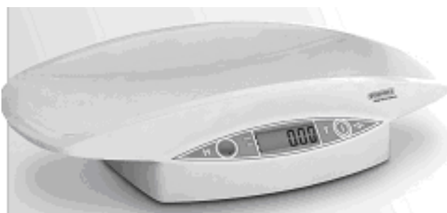
Рисунок 2 – Общий вид весов исполнения 7725.01.001