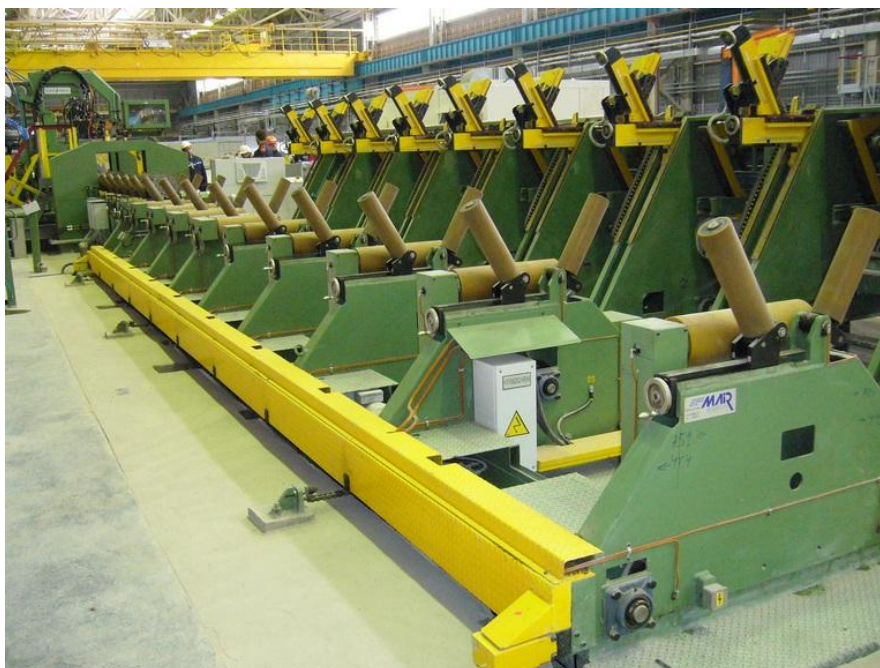
Рисунок 1 – Общий вид весов электронных Pocket Truck