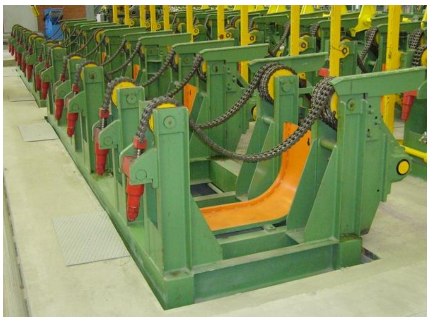
Рисунок 1 – Общий вид весов электронных Pocket