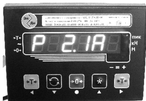
Рисунок 1. Внешний вид электронного блока с изображением версии программного обеспечения.

Т – вариант исполнения упругого элемента (1; 2; 3; 4; 5; 6; 7 приведен на рисунке 2).