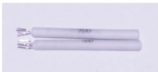
Рисунок 4 – Чувствительные элементы ЧЭПТ