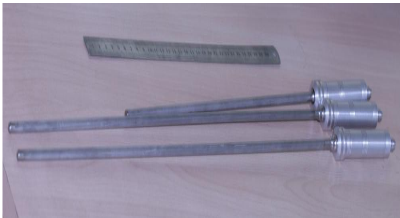
Рисунок 1 – Термометры ПТСВ-1, ПТСВ-3, ПТСВ-4, ПТСВ-5

Внешний вид термометров и ЧЭПТ представлен на рисунках 1 – 4.