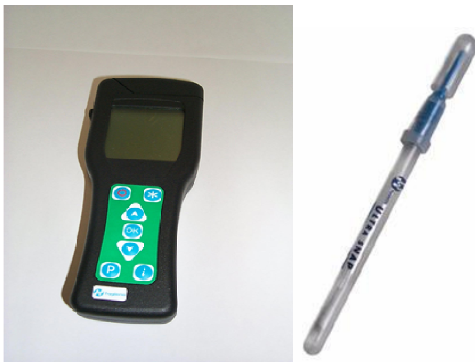
Рисунок 1 – Общий вид Люминометра System SURE Plus

Конструктивно люминометры представляют собой светоизолированное кюветное отделение и регистрирующее устройство, расположенных в едином корпусе. Измерения проводят с помощью пробирок Ultrasnap (Aquasnap) с реагентами и одноразовыми тампонами для отбора пробы.