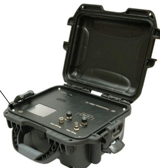
Рисунок 1 – Общий вид гигрометра ИВА–10 М