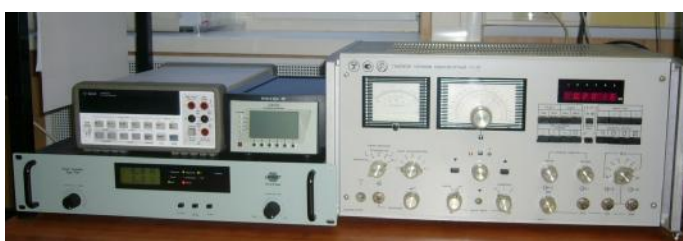
Рис. 1 Внешний вид виброустановки