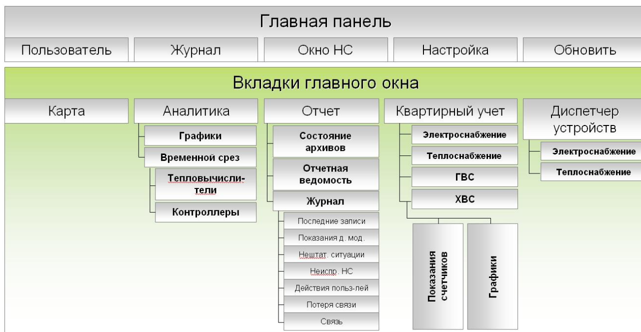
Р и с у н о к 2 – Структура меню клиентской программы ИИС «ИЦ ЭТА».