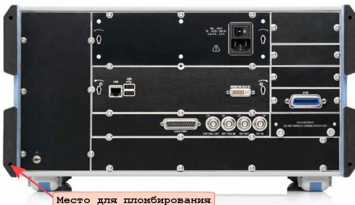
Рисунок 2 – Задняя панель и место для пломбирования анализаторов цепей векторных R&S ZNC3, ZNB4, ZNB8