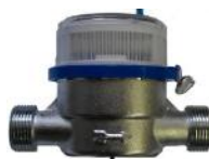
б) LXS R-15