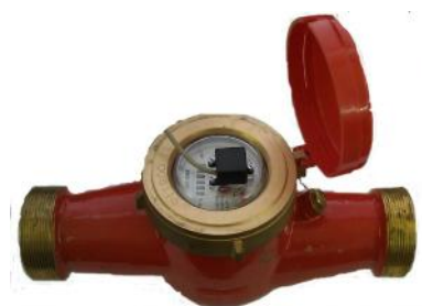
в) LXS GR-50