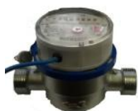
а) LXS G-15