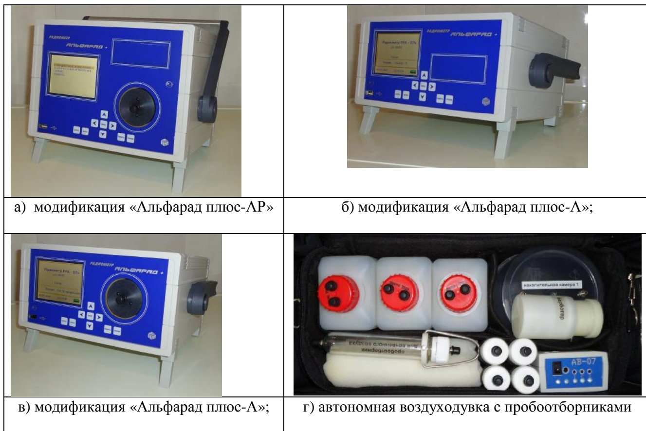
Рисунок 1 Внешний вид блоков Комплекса трех модификаций и автономной воздуходувки с пробоотборными устройствами.