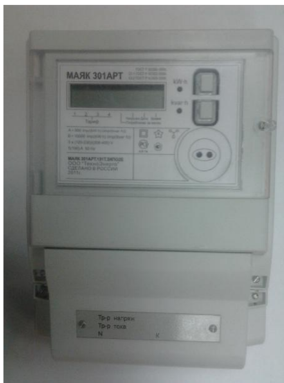
Рисунок 1 – Внешний вид счетчика с закрытой крышкой клеммной колодки

Внешний вид счетчика МАЯК 301АРТ с закрытой крышкой клеммной колодки приведен на рисунке 1. Схема опломбирования приведена на рисунке 2.