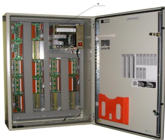
Рисунок 1 – Вариант навесного исполнения РАС