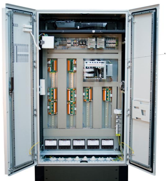
Рисунок 2.- Вариант стоечного исполнения РАС