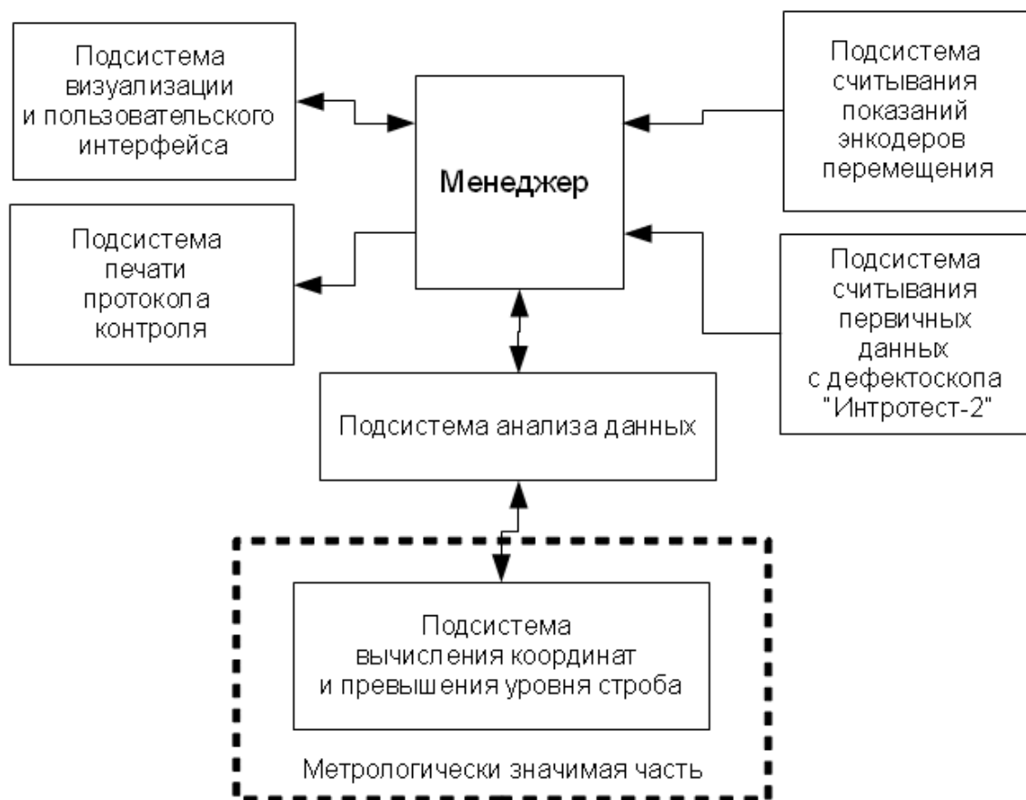
Рисунок 2 – Структурная схема ПО

Программа «АРМ УЗК осей» выполняет следующие функции: